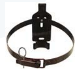
Supporto a parete per estintori con gancio posteriore

L'uso di ricambi non originali fa decadere l'Approvazione dell'estintore