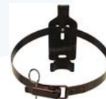
Supporto a parete per estintori con gancio posteriore

L'uso di ricambi non originali fa decadere l'Approvazione dell'estintore